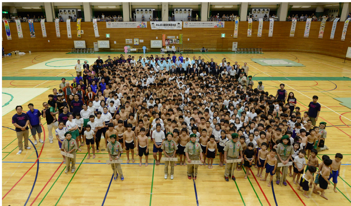
東京青年会議所 荒川区委員会 第39回わんぱく相撲 荒川区大会 2015年5月16日